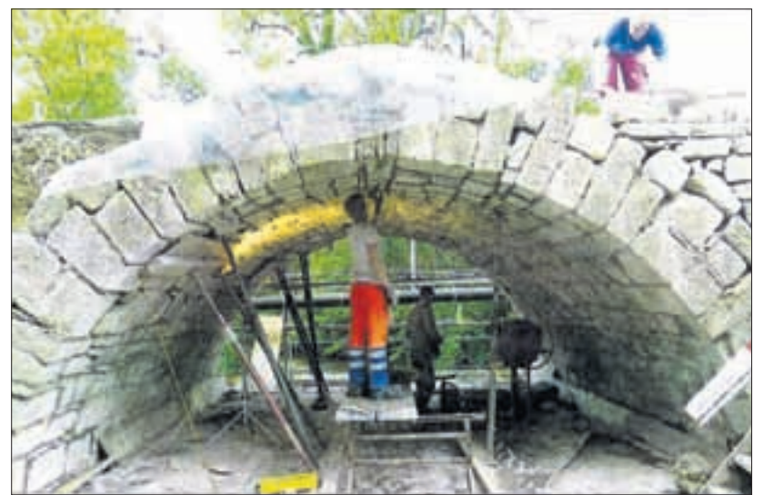
Arbeiter gaben der Sagelibrücke in den vergangenen Tagen den letzten Feinschliff.